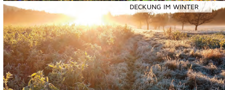
DECKUNG IM WINTER